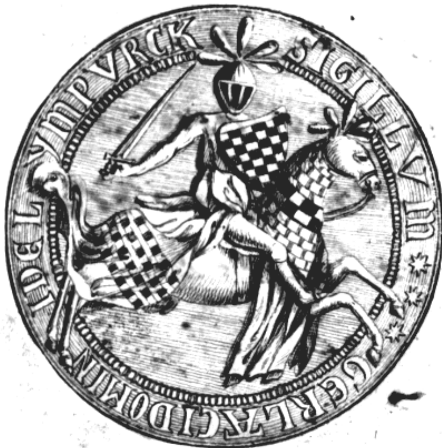
SIGILLVM GERLACI DOMINI DE LYMPVRCK (Siegel Gerlachs, des Herren von Limburg) 103

In seinem „Urteil“ führte nun Gerlach Balduin gegenüber aus, dass Ihr und der Kaiser schon lange erklärte Feinde wart, bevor der Westerburger Euch angegriffen hat. Dieser Angriff sei geschehen auf Geheiß von Kaiser Ludwig. Er, Gerlach, sei an seinen Eid dem Kaiser gegenüber gebunden. Ausdrücklich seien ja die Fehden Balduins gegen das Reich in seinem Eid ausgenommen worden. Die Urkunde schließt mit den Worten: Und so bitte ich Euch, dass Ihr hierin nicht weiter drängt. Gegeben unter unserem rückseitig angefügten Siegel im Jahre 1347 . Die beiden Heerlager lösten sich friedlich auf. Gerlach, der älteste Sohn Gerlachs, führte Reinhard, mit einem kostbaren Pferd beschenkt, heil und unversehrt zu den Seinen zurück.